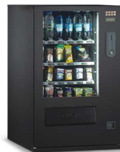
Vega 600 master.